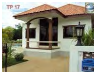
TP 17 Bungalow m. Swimming pool

Solen er meget stærk her – husk en solcreme med høj faktor.