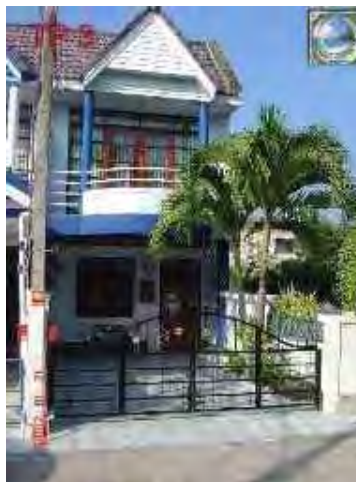
TP3 Sport Village